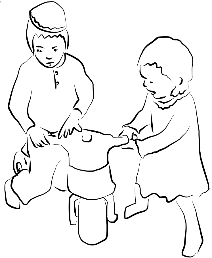
We don't need to get angry – everything is Hashgacha Protis!

”בַּעֲת פֶּעֶסוּ נִסְתַּלְקָה מִמֶּנּוּ הָאֱמוּנָה כִּי אֵילוֹ הָיָה מֵאַמִּין שְׂמִיאת ה' הִיָּתָה זֹאת לוֹ לֹא הָיָה בְּכַעַס כָּלֵל”