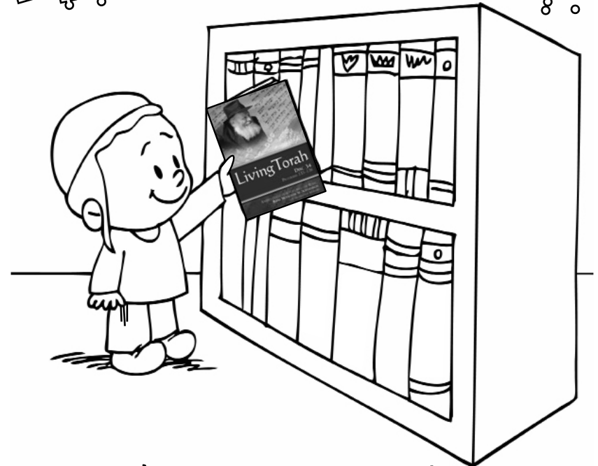
Looking at the Rebbe gives us koach to do our Shlichus with Simcha!

אֶדָּבַר בְּצִלּוֹם יְהוָה לְאֵינֶנּוּ אֶדָּבַר הַבַּיִת יְהוָה וְיִצְבֹּר וְלֹא יִדַּע מִי אֲסַפְּמָם