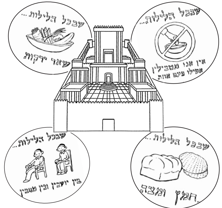
Mah Nishtana talks about Golus and Geulah!