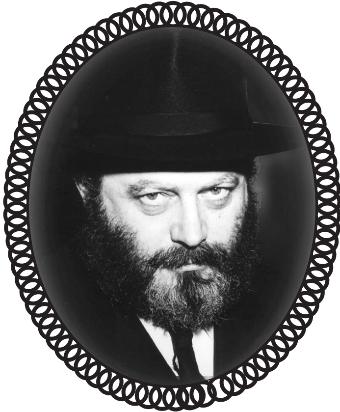
A Rebbe gives us koach to have Yiras Shomayim

”אטו יראָה מילתא זוטרתִי היא אין לגבי מלשה מילתא זוטרתִי היא וכו'”