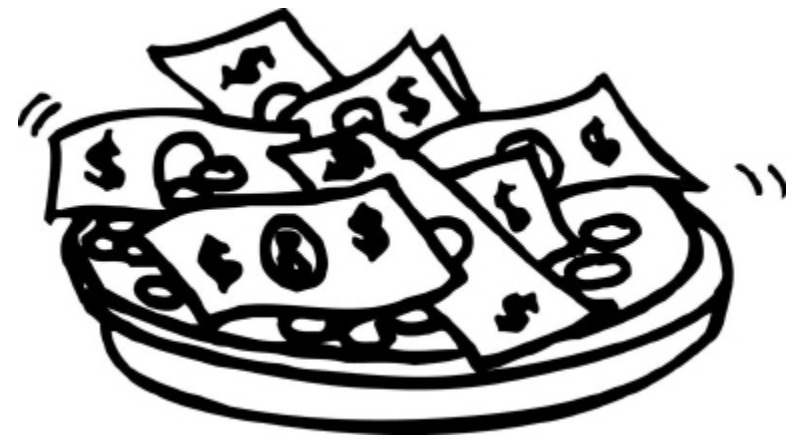
We get parnasa every day from Hashem's bracha, and from how we act!

הַתְּקַעוּ בַּחֲדָשׁ שׁוֹפָר בְּפִסְגֵּה לְיוֹם תְּהִלָּתוֹ: כִּי חָק לְיִשְׂרָאֵל הוּא מִלְּפָנֶיךָ לְאֱלֹהֵי יִשְׂרָאֵל: