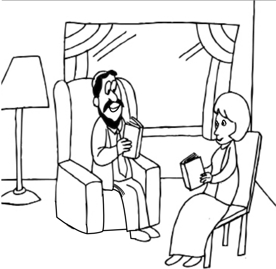
A husband and wife have to give each other kavod.

מצות לא תעשה רס"ב: "שֵׂאֵרָה פְּסוּתָהּ וְעִנְיָתָה לֹא יִגְרַע" (פרשת משפטים)