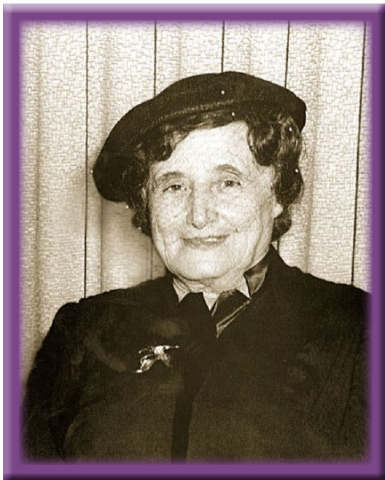
היינט איז די יארצייט פון רביצין חנה - דעם רבינ'ס מאמע