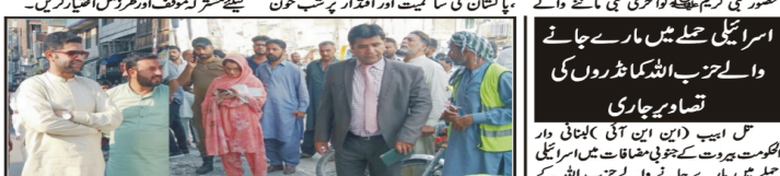
ایف ڈی اے کے تحت غیر قانونی ہاؤسنگ سکیموں کو ختم کرنے کے لیے ایک نیا قانونی فریم ورک تیار کیا گیا ہے

قادیان میں مسلمانوں کو نقصان پہنچانے کی کوشش کر رہے ہیں۔ ایف ڈی اے کے تحت غیر قانونی ہاؤسنگ سکیموں کو ختم کرنے کے لیے ایک نیا قانونی فریم ورک تیار کیا گیا ہے۔ اس کے تحت غیر قانونی ہاؤسنگ سکیموں کو ختم کرنے کے لیے ایک نیا قانونی فریم ورک تیار کیا گیا ہے۔