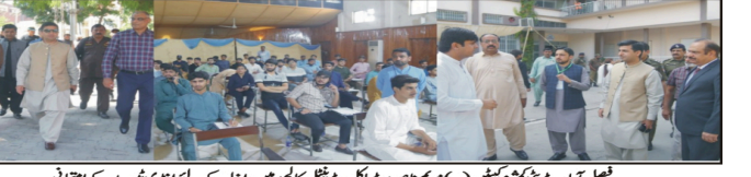
فیصل آباد ڈیپٹی کمشنر (ایم ایم) نے برائے انسداد ڈھنگی اجلاس کی صدارت کر رہے ہیں

ایک یوکریینی جوہری تحقیقات پر حملے کی منصوبہ بندی کا انکشاف۔ ایف ڈی اے کے تحت غیر قانونی ہاؤسنگ سکیموں کو ختم کرنے کے لیے ایک نیا قانونی فریم ورک تیار کیا گیا ہے۔ اس کے تحت غیر قانونی ہاؤسنگ سکیموں کو ختم کرنے کے لیے ایک نیا قانونی فریم ورک تیار کیا گیا ہے۔