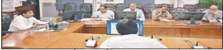
فیصل آباد ڈیپٹی کمشنر (ایم ایم) نے برائے انسداد ڈھنگی اجلاس کی صدارت کر رہے ہیں